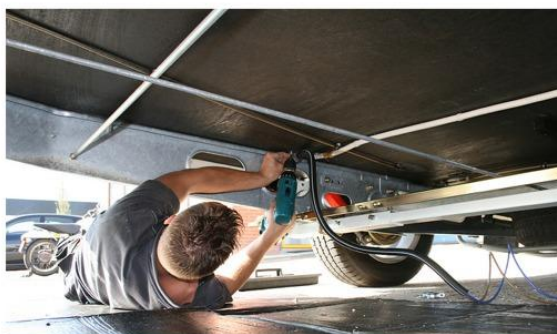
Stap 11: Afwerking kabels in montage slang