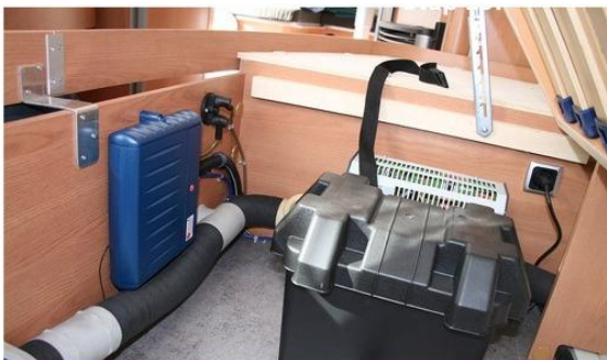
Stap 17: Accubak