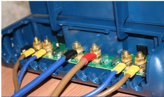
Stap 13: Aansluiten kabels op elektronica