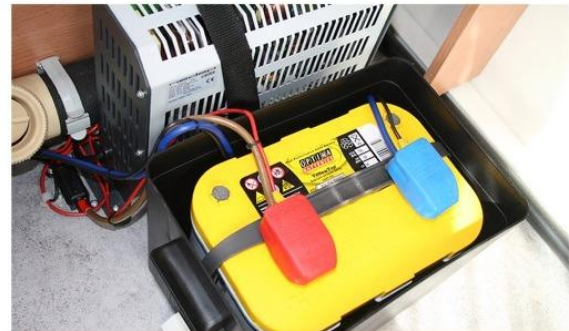
Stap 16: Aansluiten accu