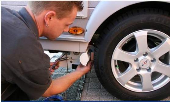
Stap 5: Afstellen van rol tot band