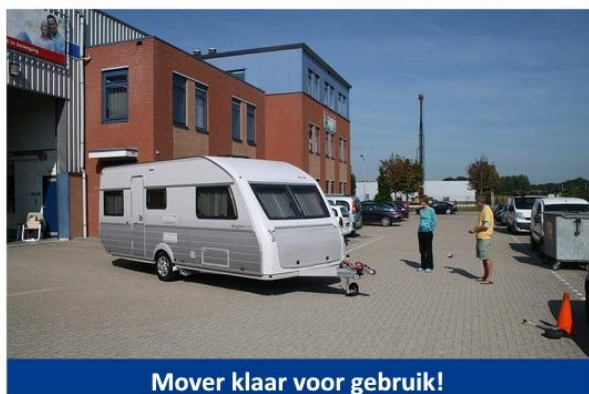
Mover klaar voor gebruik!