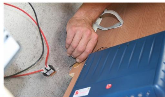
Stap 10: Doorvoer antenne