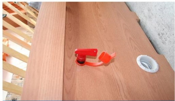
Stap 14: Plaats bepalen hoofdschakelaar