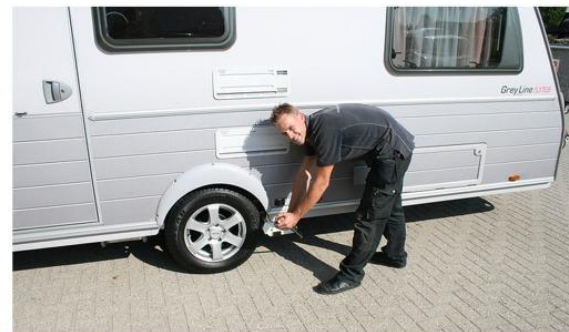
Stap 18: Plaatsen rol op band