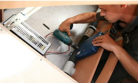
Stap 9: Bevestigen elektronica