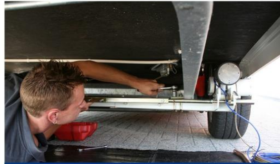
Stap 6: Klemplaten vastzetten op chassis