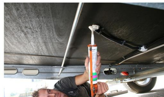
Stap 12: Afkitten gaten bekabeling