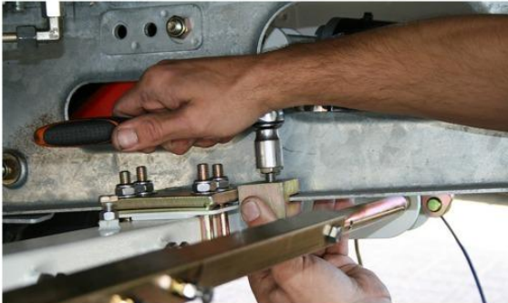
Stap 7: Montage stopblok